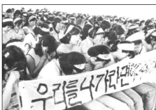
<YH 무역 여성 노동자 농성>