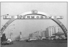
<100억불 수출의 날 기념>